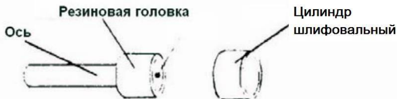
Установка фетровой насадки.